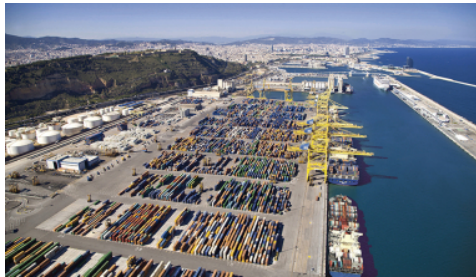
El Colegio Oficial de Agentes de Aduanas y Representantes Aduaneros de Barcelona confirma que ya ha pedido explicaciones al departamento de Aduanas e IIEE.