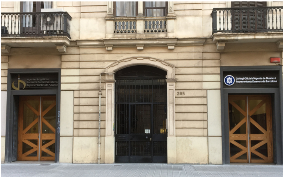
Sede del COACAB en Barcelona.

COACAB, Formación, Representante Aduanero