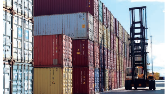
La representación directa queda sin sentido.